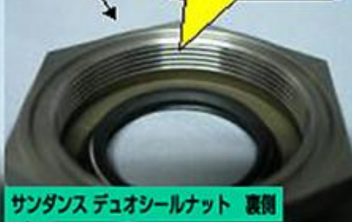
サンドانس デュオシールナット 裏側

今まで存在したデュオシールナットは、厚みがあつた為、スチールプライマリー（パンヘッド以前）の車両には使用できませんでした。サンドانسでは、新たにオイルシールから制作する事によって、厚みの薄いデュオシールナットを制作する事に成功し、取付不可能だった車種にも対応する事ができたのです。さらにネジピッチを従来のもものより多く刻んだ為、よりしっかりと止まります。