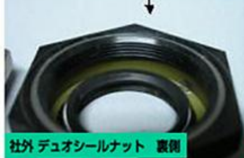
社外 デュオシールナット 裏側