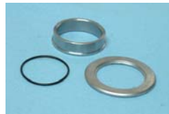
Aタイプ('30~'79) Bタイプ('80~'81) Cタイプ('82~'84)